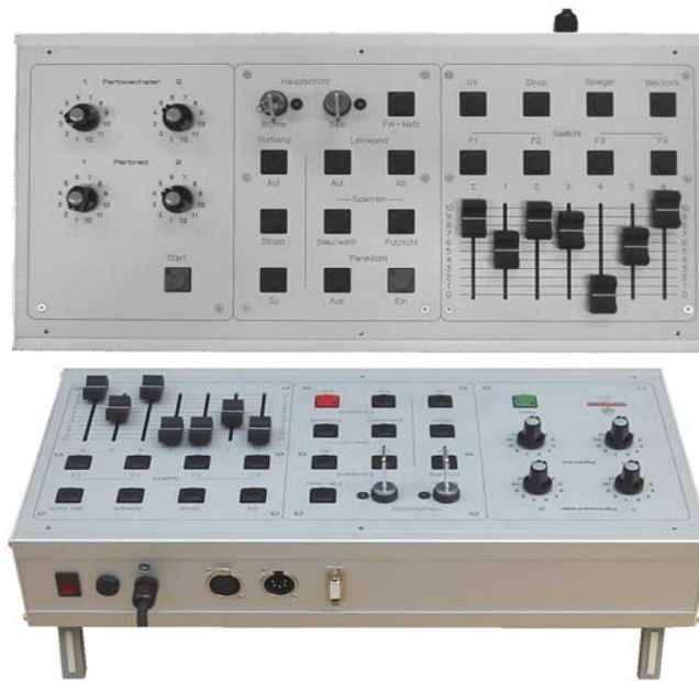
Nebenbedienpult für Farbwechsler, Schütze, Vorhangsteuerung, Panikbeleuchtung, Sperrfunktionen, div. Schalter und Saallicht mit Festeinstellungen