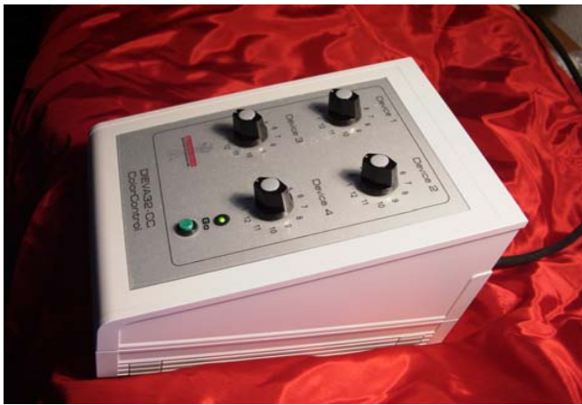
Steuerung für 4 Rollenfarbwechsler mit 12 Farben